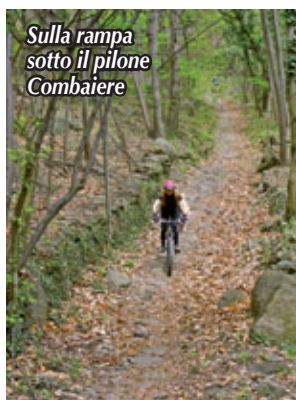
Sulla rampa sotto il pilone Combaiere

Una volta superata tale difficoltà, si segue un'ottima mulattiera lastricata, ignorando un bivio sulla destra e si arriva, dopo una compressione, in corrispondenza di un tornante, a incrociare la strada asfaltata che sale da Siliodo (km 7,80, quota 768 m). Proseguire in discesa su asfalto sino al tornante successivo dove occorre abbandonare l'asfalto per imboccare una strada sterrata che parte dalla curva. Passare accanto a una cascina dove si riprende la mulattiera che passa sulla destra del "Truc del Serro" e scende verso Condove (km 8,25, quota 760 m, pilone Combaiere). Di qui affrontare la sezione chiave dell'itinerario con una sequenza di tornanti stretti su fondo lastricato (massimo S2) che conducono su una spettacolare rampa rettilinea in discreta pendenza (foto). Quindi proseguire in discesa fino a giungere all'intersezione con una sterrata (km 8,96, quota 530 m, 4 gradini in legno ripidi, molto difficili da fare in sella, passaggio S4).